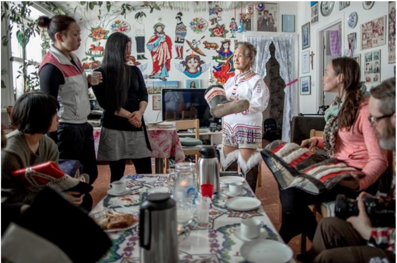
Kaffisoriartortut | Kaffe-mik