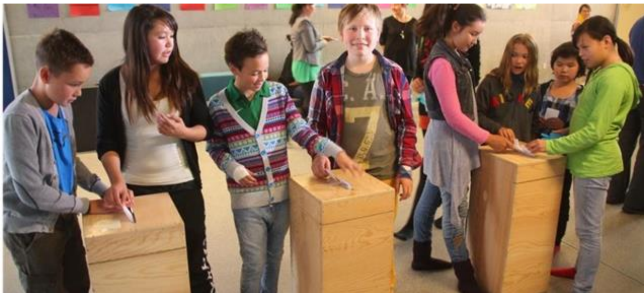
Tamat oqartussaaqataanerat assigiinngitsorpasuarunik tunngaveqarpoq | Demokrati har mange sider

Qaasuitsup Kommunia ønsker at være kendt som en gæstfri kommune med ud-syn og engagement – både nationalt og internationalt. Gennem nye samarbejder, netværk og vidensdeling og ved ny brug af moderne teknologi vil vi orientere os globalt og skabe grobund for nye venskaber og fremtidig udvikling.