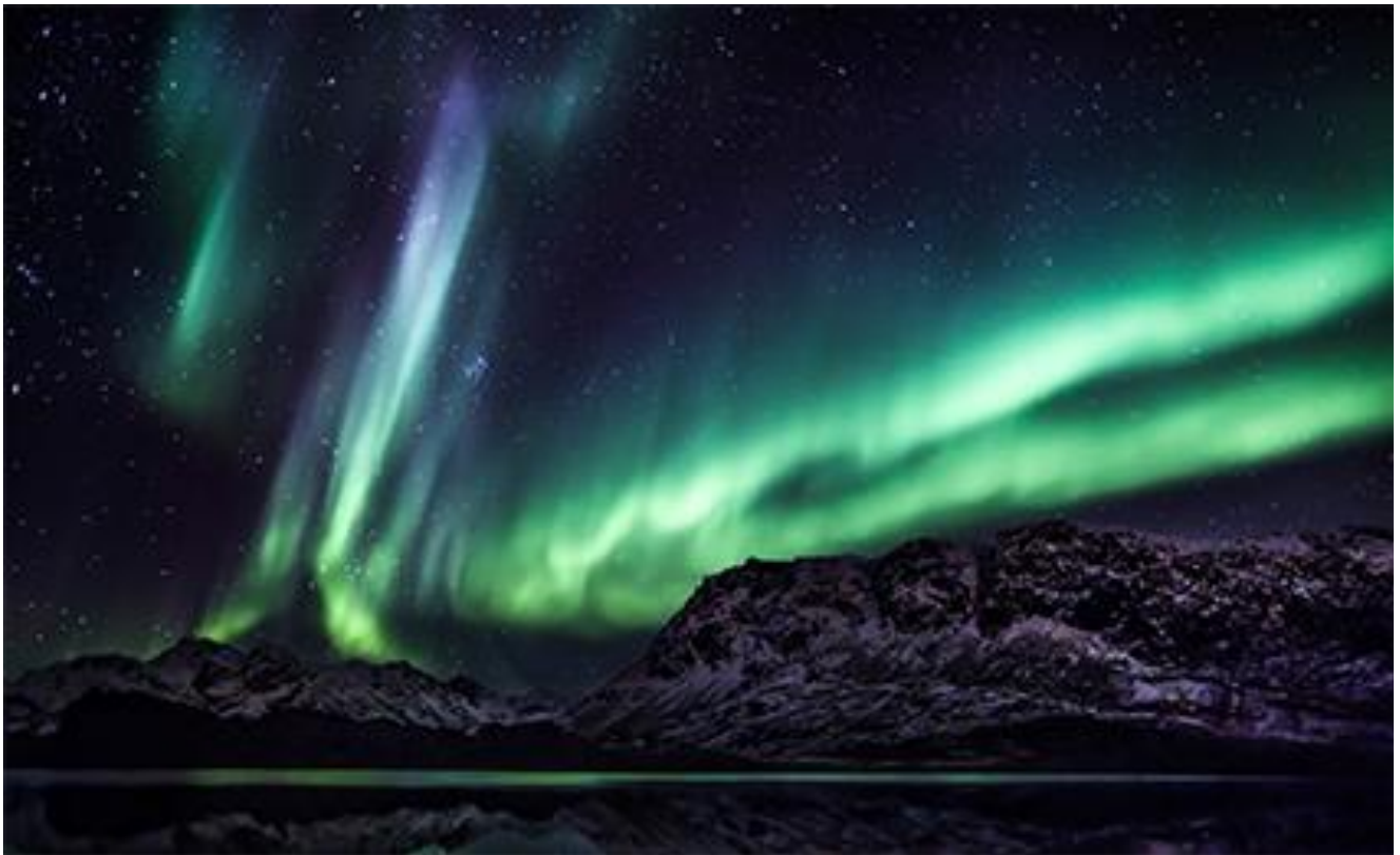
Arsarnerit | Nordlys