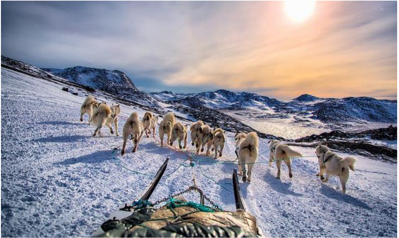
Qimussertarfik | Slædetur

Qaasuitsup Kommunia vil komme fremtidens behov til gode attraktive uderum i møde, gennem borgerinddragelse og udarbejdelse af en rekreativ grøn plan.