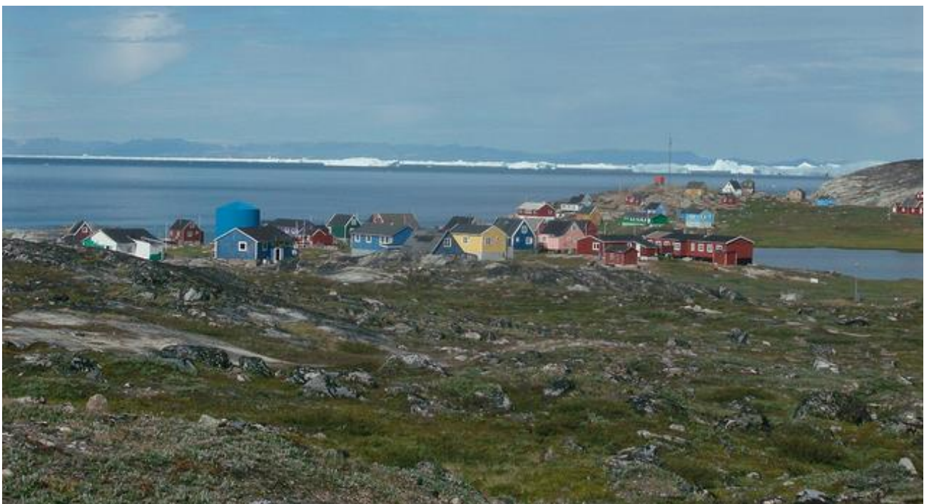
Ilimanami isikkivik | Udsigt over Ilimanaq

Men også ved at involvere de ældre borgere, der ofte er i besiddelse af vigtig viden om vores fortid og historie vil vi kunne gøre kulturarven levende og vedkommende.