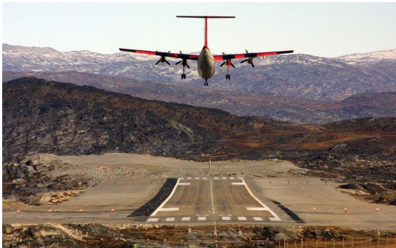
Ilulissanut tikinneq | Ankomst til Ilulissat

Ved at fokusere på gæstfrihed kan vi bygge videre på den traditionelle nordvestgrønlandske venlighed, varme og åbenhed.