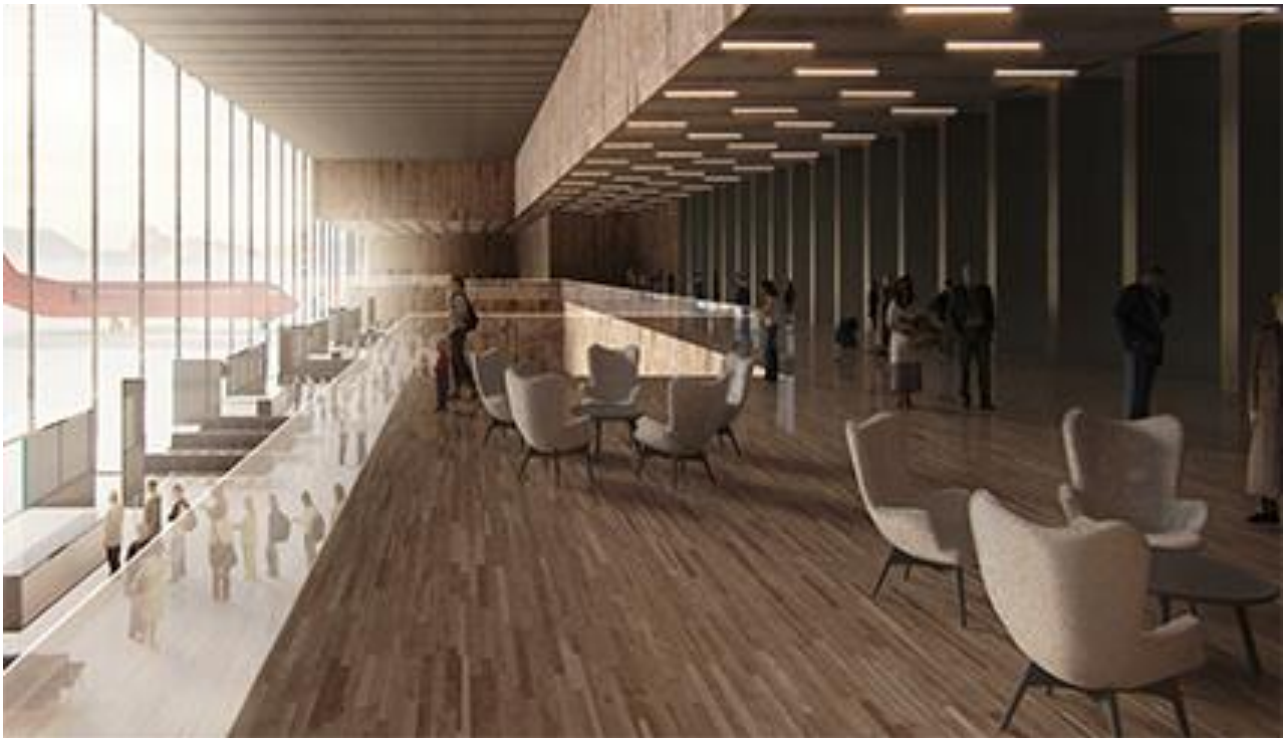
Mittarfimmi ilaasunut uninngaartarfik | Ankomsthal i lufthavn

Kommunen vil i fremtiden arbejde aktivt på at udvikle sådanne samarbejder om udviklingsprojekter, der kan være med til at løse de problemstillinger kommunen står i. Ny viden og forskning er en forudsætning for holdbare løsninger.