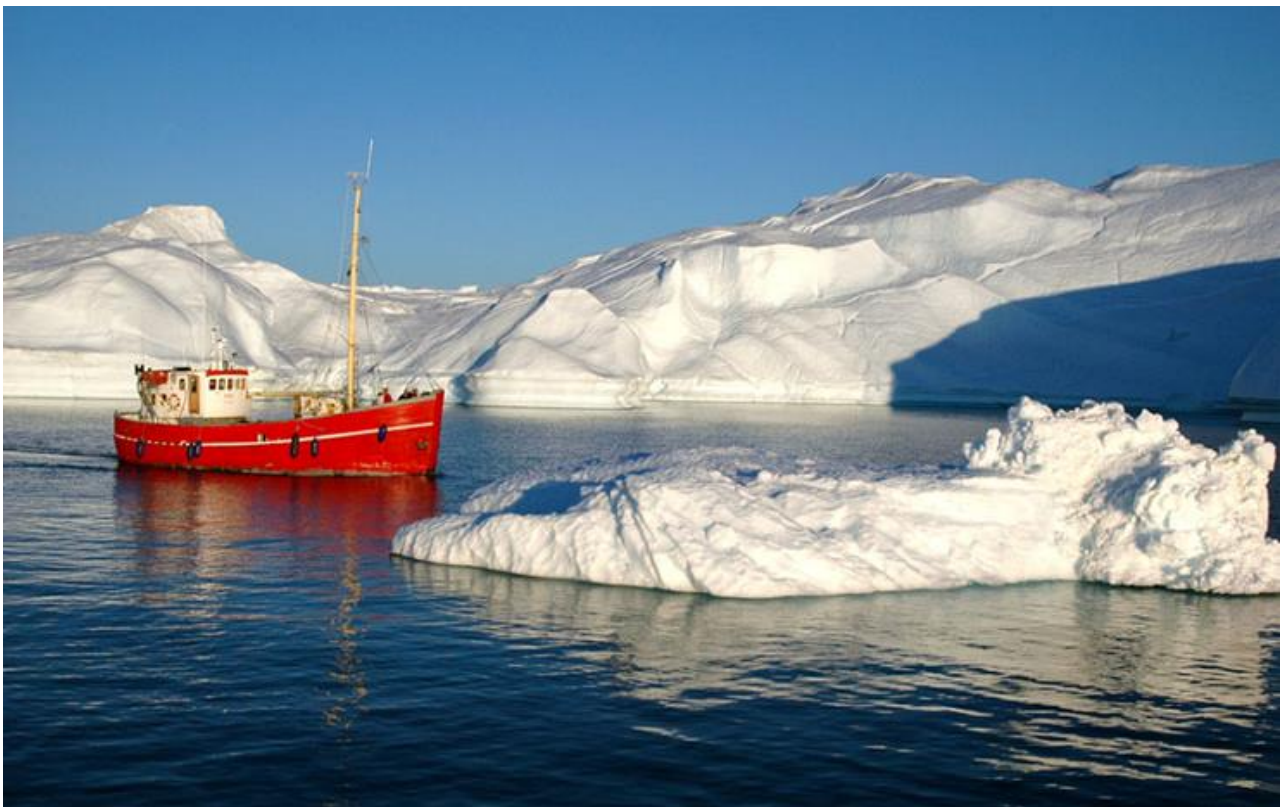
Seqerngup kaaviinnarnerata nalaali takornarissanik angallassineq | Midnatssejlad med turister

Der skal sættes massivt på uddannelse, opgradering og læring, så vi lokalt kan drage nytte af udviklingen – både på den korte og lange bane.