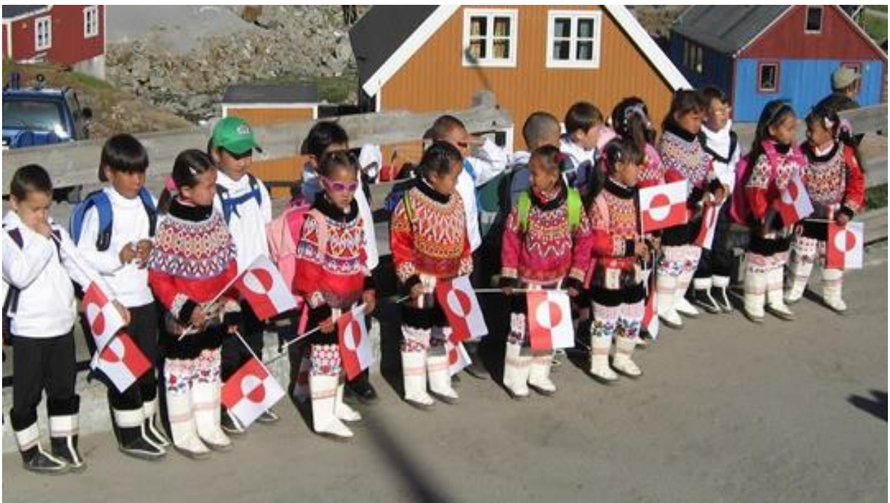
Atualeqqartut | Første skoledag

Qaasuitsup Kommunia satser på en ud-bygning og styrkelse af de nuværende ud-dannelsesinstitutioner. Samtidig har kom-munen tanker om at udbygge uddannel-sesområdet inden for klima, samfund, kul-tur og sprog.