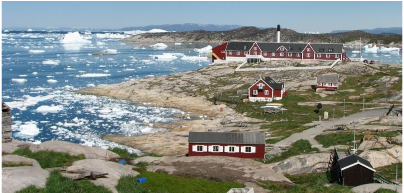
Ilulissani napparsimmavik | Sygehus Ilulissat

Suleqatigiinnerunikkut minnerusunillu aaqqissuussanik pisoqartarneratigut; assersuutigalugu akissarsititsarinnikkut, kommunep innuttaasut peqatigiiffilluamerlasuut allannguiniagaataasut erseqqinnerusumik saqqummersiniarsarerusuppai.