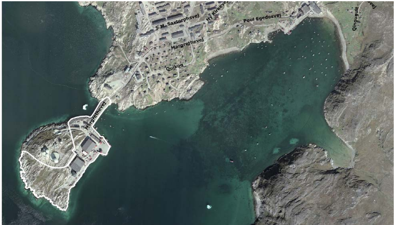
Imm. ilaa B2 | Delområde B2

Området skal vejbetjenes fra Mar-grethevej, der via dæmningen giver adgang til den øvrige del af byen.