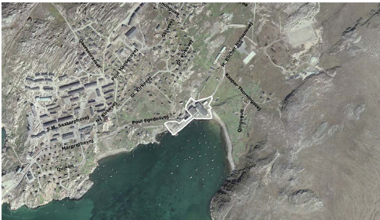
Imm. ilaa B1 | Delområde B1