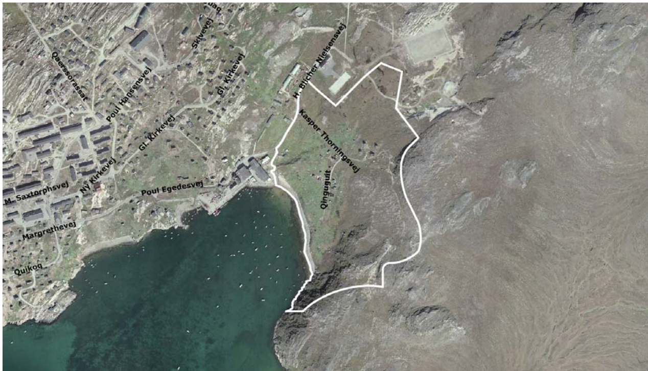
Imm. ilaa B10 | Delområde B10

Området skal vejbetjenes fra H. Blicher Niensensvej.