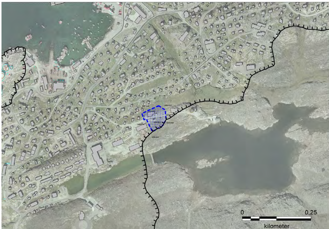
Aasianni immikkoortortaq nutaaq | Nyt delområde i Aasiaat