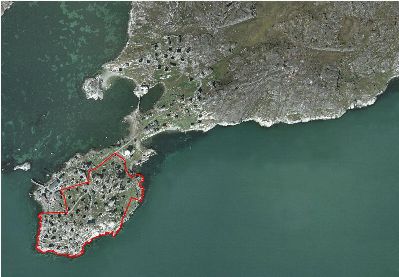
Niaqornaarsummi immikkoortortap inissisimaffia | Delområdets beliggenhed i Niaqornaarsuk