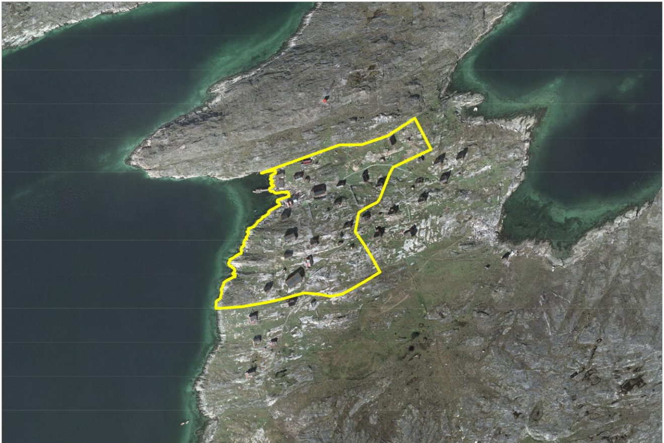
Iginniarfimmi immikkoortortap inissisimaffia| Delområdet beliggenhed i Iginniarfik