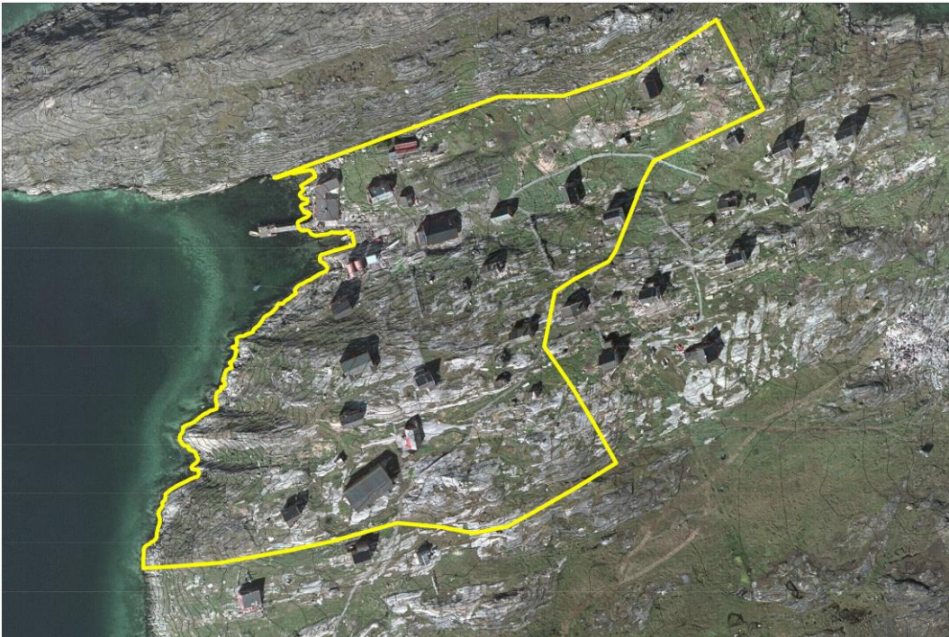
Immikkoortortaqaq C01 | Delområdet C01

Kommunimut pilersaarutip tapiata una Iginniarfiup qiterpasinnerusortaani nunaminertaq atorineqarsinnaasoq sinneruttoq allangortillugu pilersinneqarpoq.